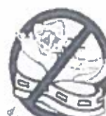
à semelle épaisse